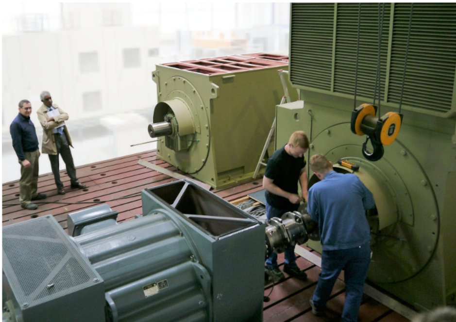
Bild: Menzel Elektromotoren betreibt zwei eigene Lastprüffelder in Berlin in einer speziell ausgebauten hochmodernen Testhalle

Berlin – Menzel Elektromotoren unterhält in Berlin einen hochmodernen Prüfstand für herstellerunabhängige Motorprüfungen bis 13,8 kV, der auch für externe Motortests bis 1.800 kW unter Last und bis 10.000 kW im Leerlauf angemietet werden kann. Deutschlandweit gibt es nur wenige konzernunabhängige Anbieter vergleichbarer Dienste. Zum Service des Spezialmotoren-Herstellers gehören u.a. Routine-, Typen- und Systemprüfungen wie z.B. Last- oder Erwärmprüfungen von Drehstrom-Asynchronmotoren mit Käfig- oder Schleifringläufer.