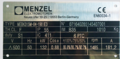
Abbildung: Kennzeichnung der Energieeffizienzklasse auf dem MENZEL Typenschild

Tel.: +49 30 34 99 22-0 · Fax: +49 30 34 99 22-999 info@menzel-motors.com Neues Ufer 19-25, 10553 Berlin (Germany)